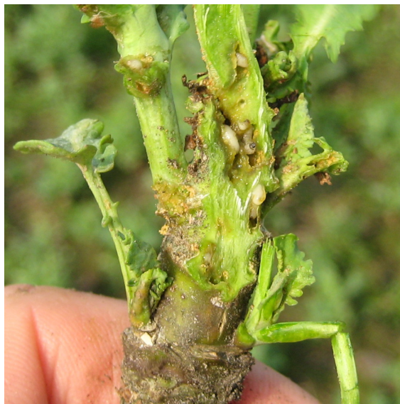
Rapsplante der er kraftigt angrebet af rapsjordloppelarver. (Klik på billedet for stor udgave)

Glimmerbøsser kan gøre skade i det tidlige knopstadium, hvor de i deres søgen efter pollen gnaver sig ind i blomsterknopperne og ødelægger frøanlæggene, så der ikke udvikles frø. Kraftige rapsplanter i god vækst kan i nogen grad kompensere for skaderne forvoldt af glimmerbøsser, men lige så vigtigt er det, at kraftige rapsplanter måske kan nå at springe i blomst, inden glimmerbøsserne når fuldt aktivitetsniveau. Når først rapsen er