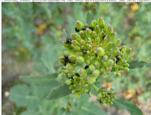
i blomst, er glimmerbøssen ikke et skadedyr men en nyttig bestøver. Rapsplante med kraftigt angreb af glimmerbøsser. (Klik på billedet for stor udgave)

Glimmerbøsser kan gøre skade i det tidlige knopstadium, hvor de i deres søgen efter pollen gnaver sig ind i blomsterknopperne og ødelægger frøanlæggene, så der ikke udvikles frø. Kraftige rapsplanter i god vækst kan i nogen grad kompensere for skaderne forvoldt af glimmerbøsser, men lige så vigtigt er det, at kraftige rapsplanter måske kan nå at springe i blomst, inden glimmerbøsserne når fuldt aktivitetsniveau. Når først rapsen er